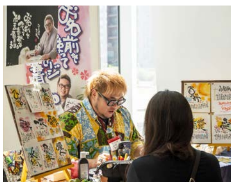
筆文字作家ことうた屋だいぞうさんが今年も出展！抽選会の景品として当たるかも？！