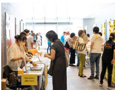
展示ブースの様子(会場は異なります)