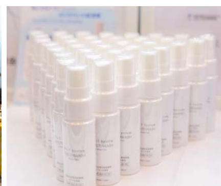
企業ブースでは、サンプルなどが提供される場合があります