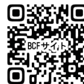
血液がんフォーラム 特設サイト

参加申込・質問 https://www.bloodcancerforum.jp/booking