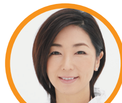
司会 中井 美穂 フリーアナウンサー