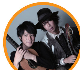
いちむじん クラシックギターデュオ

「龍馬伝」のテーマ曲を演奏した「いちむじん」のスペシャルコンサートも開催します。