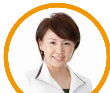
司会 松本 裕子 (uhbスーパーニュース キャスター)