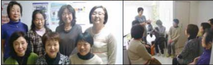
写真上/「ピアサポートよこはま」でのピアサポート風景。ゆっくり話ができる静かな空間です 写真左下/「ピアサポートよこはま」のサポーターの皆さん 写真右下/月に1回、CNJスタッフとサポーターが集まり、よりよいピアサポートを目指してミーティングを行います

サポーターは、がん体験者であり、CNJが実施する乳がん体験者コーディネーター（BEC）養成講座やがん情報ナビゲーター（CIN）養成講座を修了し、がんに対する一般の知識、科学的根拠のあるがん医療情報に関する知識、及び最新の医療情報にアクセスするスキルを持った方にお願ひしています。またサポーターは、ロールプレイや定期的なミーティングを通して、より良いピアサポートを行えるようスキルアップを目指しています。患者同士だからこそ、分かり合えることや支え合えることがたくさんあります。先輩がん患者が、自身の経験を生かして、相談者と同じ目線で寄り添いながら相談や悩みに答えています。 来年度は、助成最終年度となるので、今まで取り組んできたピアサポート事業を振り返り、成果を全国に発信していきます。さらに、神奈川県内でのピアサポート普及を目指し、ピアサポートをすでに導入している病院や関心のある病院の担当者が横に繋がりが、情報共有できる機会を作っていきたいと考えています。患者同士で支え合うピアサポートが、もっと広がることを目指しています。ピアサポートについては、左記でも詳しく紹介しています。 http://www.cancernet.jp/peersupport