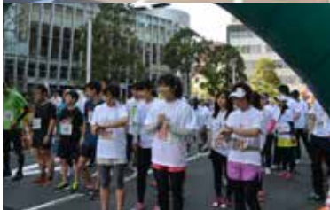
スタート時の参加者のドキドキ感が伝わってきます!参加者は、走ったり、歩いたり自分のスタイルで楽しみながら完走しました

から始まって、日に日に走れる距離が延びて、運動できる嬉しさ、楽しさを実感しています。「がんになってもがんになる前よりもずっと元気にアクティブに過ごせるという証拠ですよね。このマラソンへの参加をきっかけに、またあらたな夢が見つかったような気がします」などの声をいただきました。