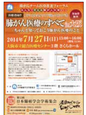
医療者向けのセミナーは大阪からスタート。フライヤーも完成!

※公式ホームページ URL : http://jlcs55.umin.jp/ ※公式フェイスブック URL : https://www.facebook.com/55HaiganGakkai ※公式ツイッター URL : http://twitter.com/55jlcs