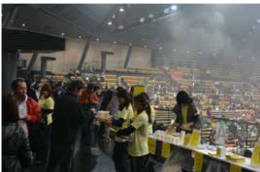
両会場では、熱気とアットホームな雰囲気でのレモネードスタンドが子どもたちにも大人気でした

3月22日、女子プロレスラー長与千種さん主催、「This女子プロレス」の会場にて、小児がん支援のレモネードスタンドを開催する機会をいただきました。 長与さんは、クラッシュ・ギャルズで有名な元女子プロレスラーで、ご存知の方も多いと思います。実は、長与さんは、昨年お父様をすい臓がんで亡くされました。お父様の最期の時期を一緒に過ごしたご体験から、がん体験者や、そのご 家族を応援したいという熱い思いを抱いています。今回、CNJの活動に賛同していただき、レモネードスタンドの機会をいただきました。会場となった大田区総合体育館には、2000名を超す来場者があり、熱気に包まれた会場で冷たいレモネードは好評でした。約1200杯を配布し、7万982円のご寄付をいただきました。 また5月3日は、男子プロレスラーの大和ヒロシさん