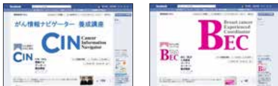
BEC・CINのフェイスブックへは下記ホームページからアクセスできます http://www.cancernet.jp/training