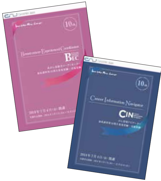
今年で第10期を迎えました！募集要綱のデザインを一新し、内容も分かりやすく見直しました