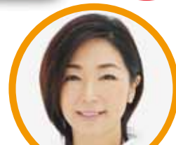
司会 中井 美穂 フリーアナウンサー

場所： 仙台サンプラザ 宮城野 (〒983-0852 宮城県仙台市宮城野区榴岡 5-11-1 仙台サンプラザ)