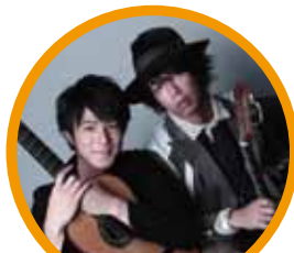
いちむじん クラシックギターデュオ

「龍馬伝」のテーマ曲を演奏した「いちむじん」のスペシャルコンサートも開催します。