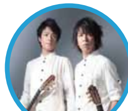
いちむじん クラシックギターデュオ

「龍馬伝」のテーマ曲を演奏した「いちむじん」のスペシャルコンサートも開催します。