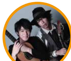
いちむじん クラシックギターデュオ

「龍馬伝」のテーマ曲を演奏した「いちむじん」のスペシャルコンサートも開催します。