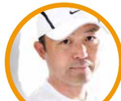
金哲彦 プロランニングコーチ