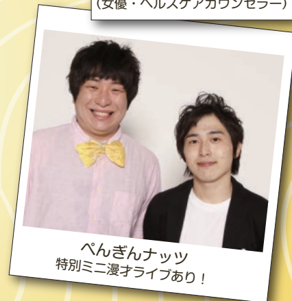
ぺんぎんナッツ 特別ミニ漫才ライブあり!