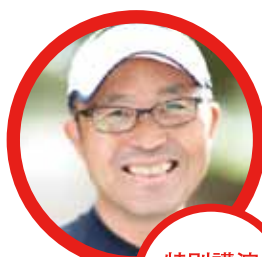
特別講演 金 哲彦